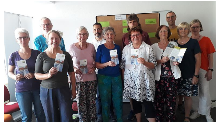
Hallo! Wir sind die Botschafter:innen der Energiewende